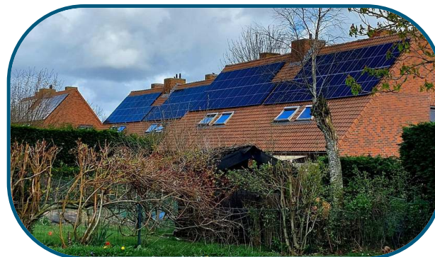
Kleikouter, De Klijte