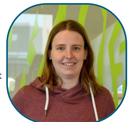
Iris afdelingshoofd projecten en patrimonium

Tegen 2050 moeten al onze woningen een energielabel A hebben. Deze uitdagingen ga ik aan samen met een super gemotiveerd team.