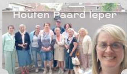
Houten Paard Ieper