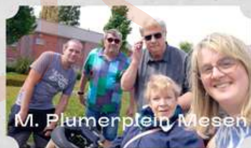
M. Plumerplein Mesen